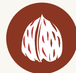
FRUTOS DE CÁSCARA